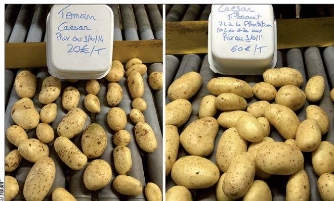
Comme chaque année, un gain significatif sur la lavabilité a été observé cette année sur un grand nombre de parcelles, notamment sur la variété Caesar.

Lorsque le Floravit® a été utilisé sans retard et aux bons stades selon les recommandations, des augmentations de rendements dans les calibres recherchés (+ 12 %), de nombre de tubercules (+ 11 %) et de qualité commerciale ont été constatées. Les essais menés en Alsace montrent notamment que 2 applications de Floravit® apportent un plus en termes de rendement et de tubérisation par rapport au témoin non traité. En variété de conservation, l'effet principal s'observe sur le grossissement. En variété à chair ferme, l'effet est plus important sur la tubérisation. En variété précoce, l'effet est plus marqué sur la matière sèche. Toutefois, compte tenu des conditions climatiques de l'année 2014, Floravit® a été souvent positionné un peu tard sur le terrain, ce qui n'a pas permis à la pomme