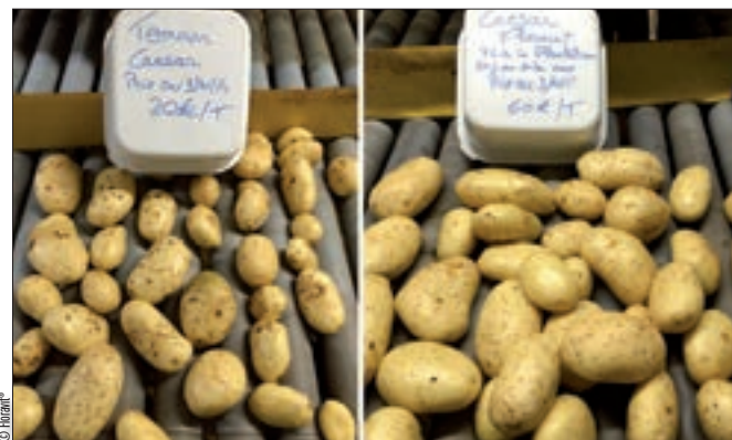
Comme chaque année, un gain significatif sur la lavabilité a été observé cette année sur un grand nombre de parcelles, notamment sur la variété Caesar.

Lorsque le Floravit® a été utilisé sans retard et aux bons stades selon les recommandations, des augmentations de rendements dans les calibres recherchés (+ 12 %), de nombre de tubercules (+ 11 %) et de qualité commerciale ont été constatées. Les essais menés en Alsace montrent notamment que 2 applications de Floravit® apportent un plus en termes de rendement et de tubérisation par rapport au témoin non traité. En variété de conservation, l'effet principal s'observe sur le grossissement. En variété à chair ferme, l'effet est plus important sur la tubérisation. En variété précoce, l'effet est plus marqué sur la matière sèche. Toutefois, compte tenu des conditions climatiques de l'année 2014, Floravit® a été souvent positionné un peu tard sur le terrain, ce qui n'a pas permis à la pomme